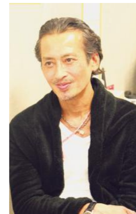
●ゲストインタビュー！ 大沢樹生 （俳優）

2012年、29歳で独立を果たしたので、約10年勤めさせていただきました。独立はゴールでありスタートと考えており、一緒に仕事をしようと言っていた仲間が30歳の節目を迎えたこと、そして東日本大震災を経験したことで独立への気持ちが強くなっていったんです。最初は友人と2人でスタートして、実際の現場には応援の人たちが入っていただきました。そこから徐々に人が増えて、2年で法人化を果たしました。お恥ずかしい話ですが、当時の私は考えが甘く、見切り発車で独立したので、最初は仕事がなくて苦労しました。そんな時、前